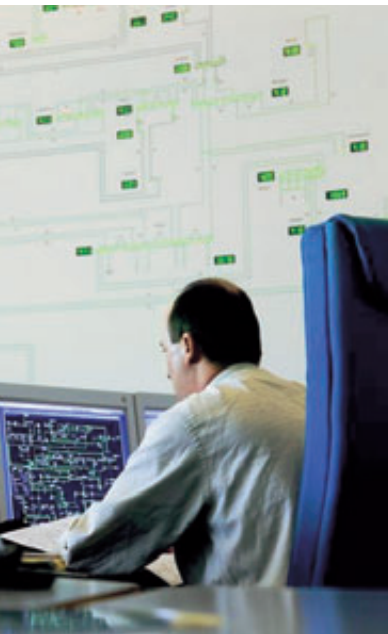
riesigen Kontrolltafel haben es ein paar Techniker plötzlich eilig

Das Ergebnis des Rechenwerks: Ganz Europa könnte zu 100 Prozent mit Strom aus erneuerbaren Quellen versorgt, der Anteil der Windenergie dabei auf bis zu 70 Prozent gesteigert werden. Konventionelle Kraftwerke zur Grundversorgung wären entbehrlich. Wenn die Zahlen des For-